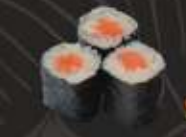
11. Sake Maki Zalm, 3 st. Salmon, 3 pcs.