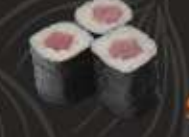
12. Tekka Maki Tonijn, 3 st. Tuna, 3 pcs.