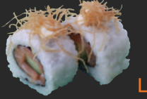
19. Philly Roll Gerookte zalm, komkommer, roomkaas & aardappelsliertje, 2 st. Smoked salmon, cucumber, cream cheese & potato strings, 2 pcs.