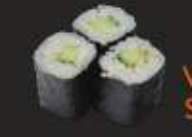
10. Kappa Maki Komkommer, 3 st. Cucumber, 3 pcs.