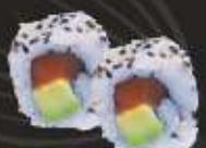
16. Sake Avocado Maki Zalm, avocado, Jap. mayo & sesam, 2 st. Salmon, avocado, Jap. mayo & sesame, 2 pcs.