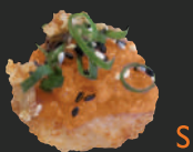
23. Kota Radja Sake Nigiri Zalmtartaar, krokante rijst, ui-kruim, sesam & lente-ui, 3 st. Salmon tartare, crispy rice, onion crumb, sesame & spring onion, 3 pcs.