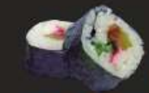
13. Futo Maki Garnaal, krabstick, komkommer, retich & Jap. mayo, 2 st. Shrimp, crab stick, cucumber, pickles, & Jap. mayo, 2 pcs.