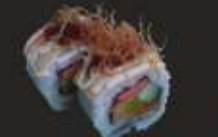
9. Cheesy Pork Maki Gedroogde vakensliertjes met kaas, 2 st. Dried pork strings with cheese, 2 pcs.