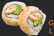
17. Crunch Maki Garnaal, komkommer & tempura kruim, 2 st. Shrimp, cucumber & tempura crumb, 2 pcs.