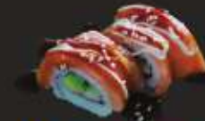
14. Sake California Maki California maki met zalm, 2 st. California maki with salmon, 2 pcs.