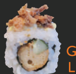
22. Chicken Maki Kip, Jap. mayo, komkommer & ui-kruim, 2 st. Chicken, Jap. mayo, cucumber & onion crumb, 2 pcs.