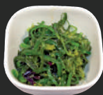
31. Zeewiersalade Seaweed salad