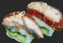
27. Unagi Avocado Maki Paling met avocado & komkommer, 2 st. Eel with avocado & cucumber, 2 pcs.