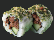
20. Spicy Beef Maki Gegrild pikant kalfsvlees met wasabi, sesam & zeewier 2 st. Grilled spicy veal with wasabi sesame & seaweed, 2 pcs.