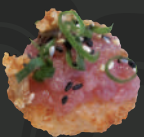
24. Kota Radja Maguro Nigiri Tonijntartaar, krokante rijst, ui-kruim sesam & lente-ui, 3 st. Tuna tartare, crispy rice, onion crumb, sesame & spring onion, 3 pcs.