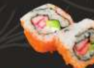
15. California Maki Krabstick, komkommer, avocado, Jap. mayo & tobiko, 2 st. Crab stick, cucumber, avocado, Jap. mayo & roe, 2 pcs.