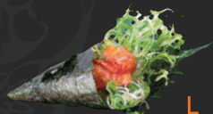
30. Sake Temaki Zalm, avocado & Jap. mayo, 1 st. Salmon, avocado & Jap. mayo, 1 pc.